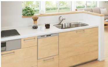
ビルトイン食器洗機の設置