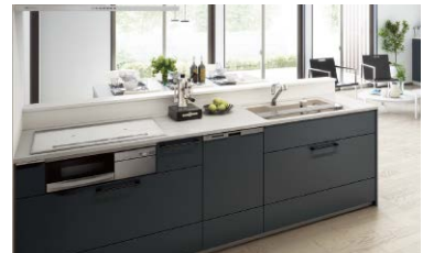
キッチンセット(対面化改修)