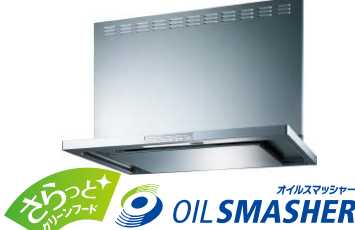
掃除しやすいレンジフードの設置