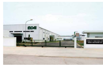
Eidai Vietnam Co., Ltd.