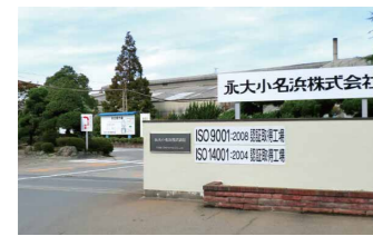
永大小名浜株式会社