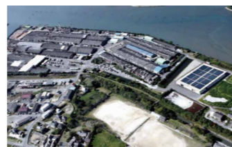
山口・平生事業所